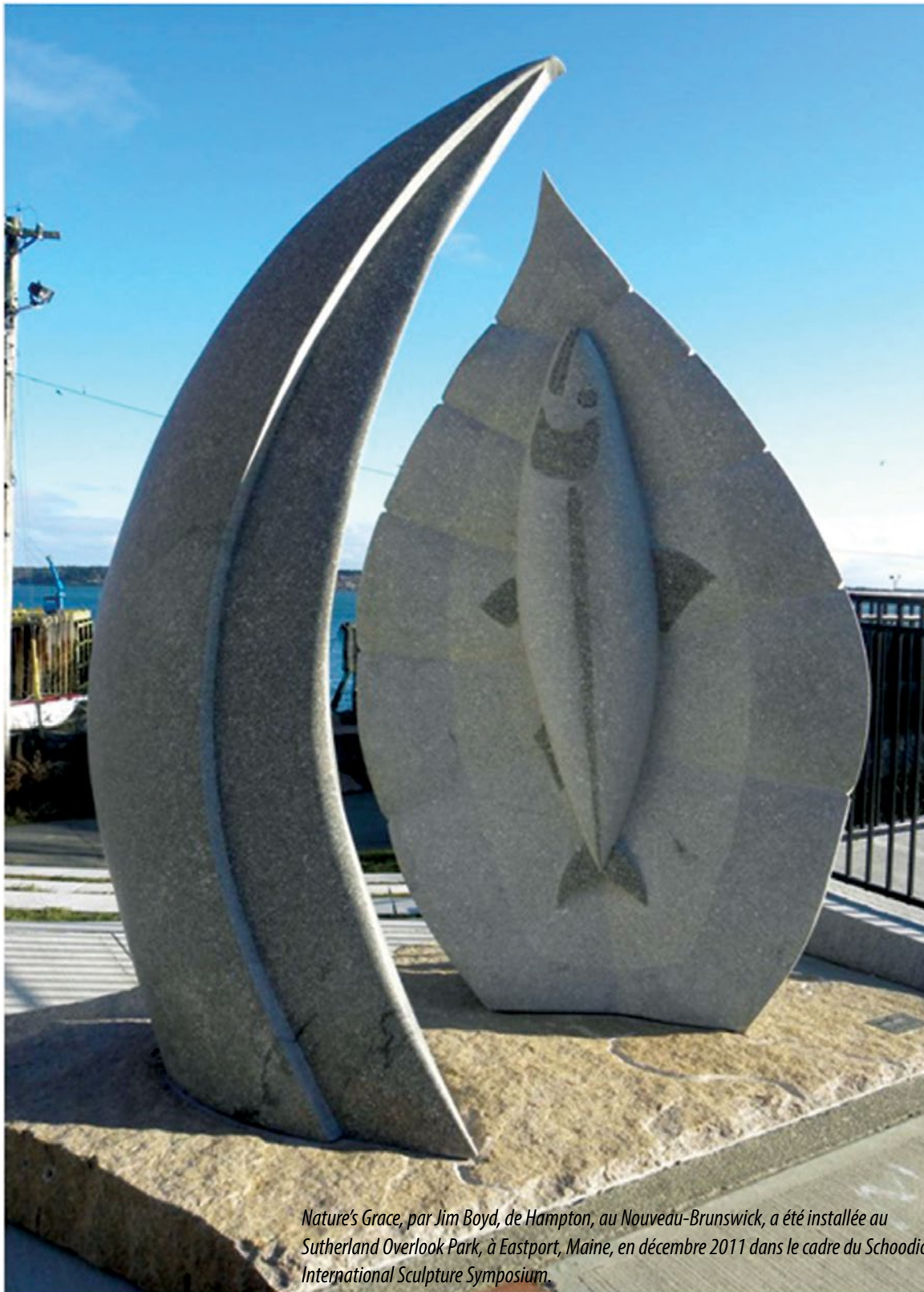
Nature's Grace, par Jim Boyd, de Hampton, au Nouveau-Brunswick, a été installée au Sutherland Overlook Park, à Eastport, Maine, en décembre 2011 dans le cadre du Schoodic International Sculpture Symposium.