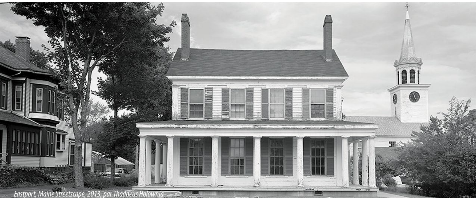
Eastport, Maine Streetscape, 2013, par Thaddeus Holownia