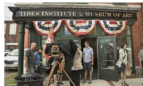
Eastport, Maine Streetscape, 2013 par Thaddeus Holownia

Dans son rôle de ressource et de catalyseur culturel qui travaille avec divers partenaires des deux côtés de la frontière entre les États-Unis et le Canada, le Tides Institute se spécialise dans les collections culturelles, les expositions, les œuvres récentes et la programmation publique et éducative.